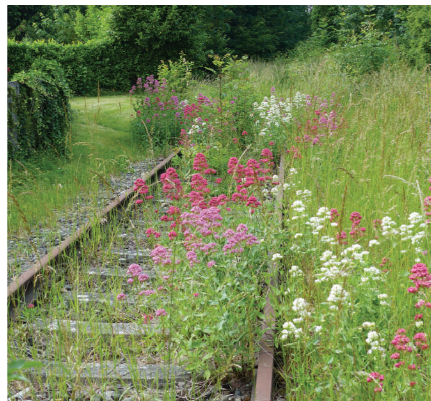
Voie ferrée Doullens vers Amiens

Il s'agira également de valoriser les anciennes voies ferrées, via le développement des pistes cyclables et notamment l'aménagement d'une véloroute verte sur l'ancienne voie ferrée Doullens-Gamaches (en collaboration avec les territoires voisins).