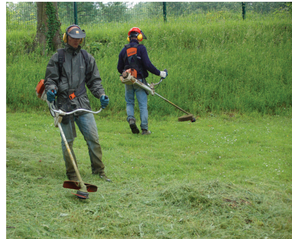
Chantier d'insertion Espaces Verts

Il s'agira notamment de mobiliser tous les acteurs de la formation professionnelle (Etat, collectivités, chambres consulaires, organismes de formation, afin de structurer, développer, renforcer l'offre et les équipements de formation professionnelle.