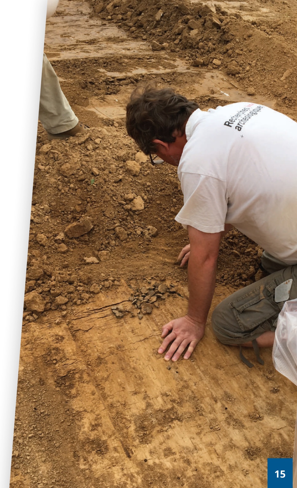
Fouilles archéologiques à la ZAC de la Montignette

Dans cette même logique, et afin d'être réactive aux demandes d'implantation des entrepreneurs, la CCTNP cherchera également à poursuivre la dynamique enclenchée à Bernaville en construisant ou réhabilitant des hôtels d'entreprises . Ces espaces permettront d'attirer à la fois des entreprises artisanales et tertiaires.