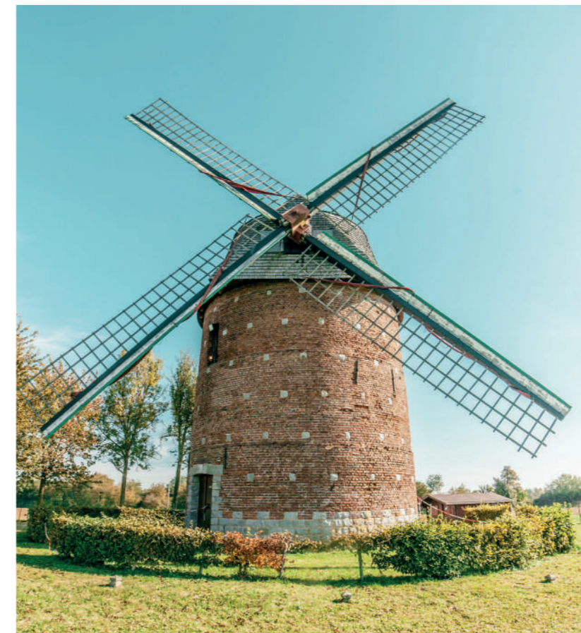
Moulin de Candas