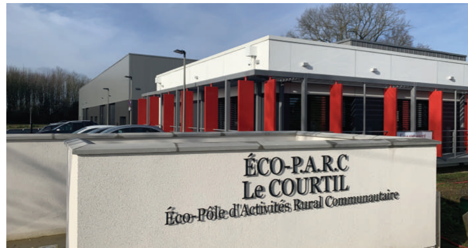
Hôtel d'entreprises à Bernaville

La CCTNP s'engage aux côtés du Département, pilote sur le déploiement de la fibre à l'horizon 2024, à accompagner le développement du télétravail , des espaces de coworking et de nouvelles pépinières d'entreprises afin d'attirer les nouveaux « nomades » du travail.