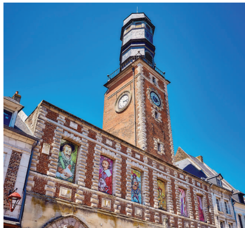
Beffroi de Doullens

L'objectif est de réhabiliter, entretenir et valoriser le patrimoine existant en mêlant culture et tourisme (Citadelle, Cité souterraine de Naours, les beffrois, la salle du Commandement Unique...) afin d'encourager et d'accompagner les projets culturels susceptibles d'être accueillis sur le territoire.